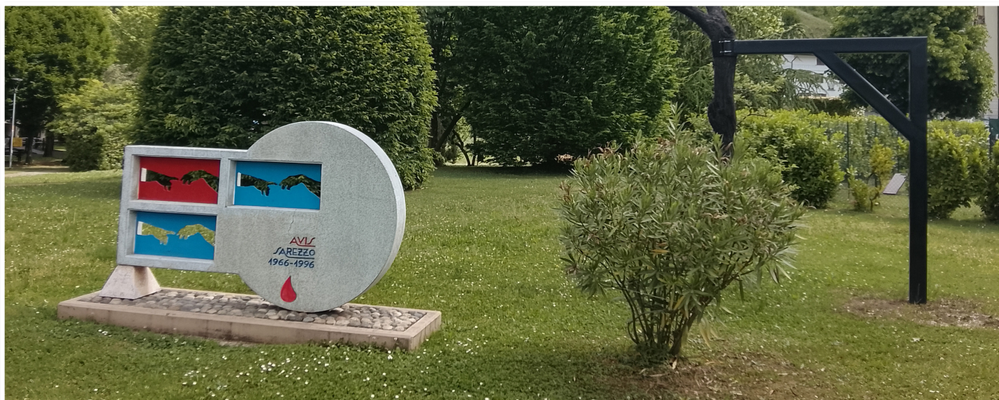
Il parco Donatori di sangue con il monumento posato in occasione del trentesimo anno dalla fondazione e l'installazione N-Quiry di Tiziano Ronchi.