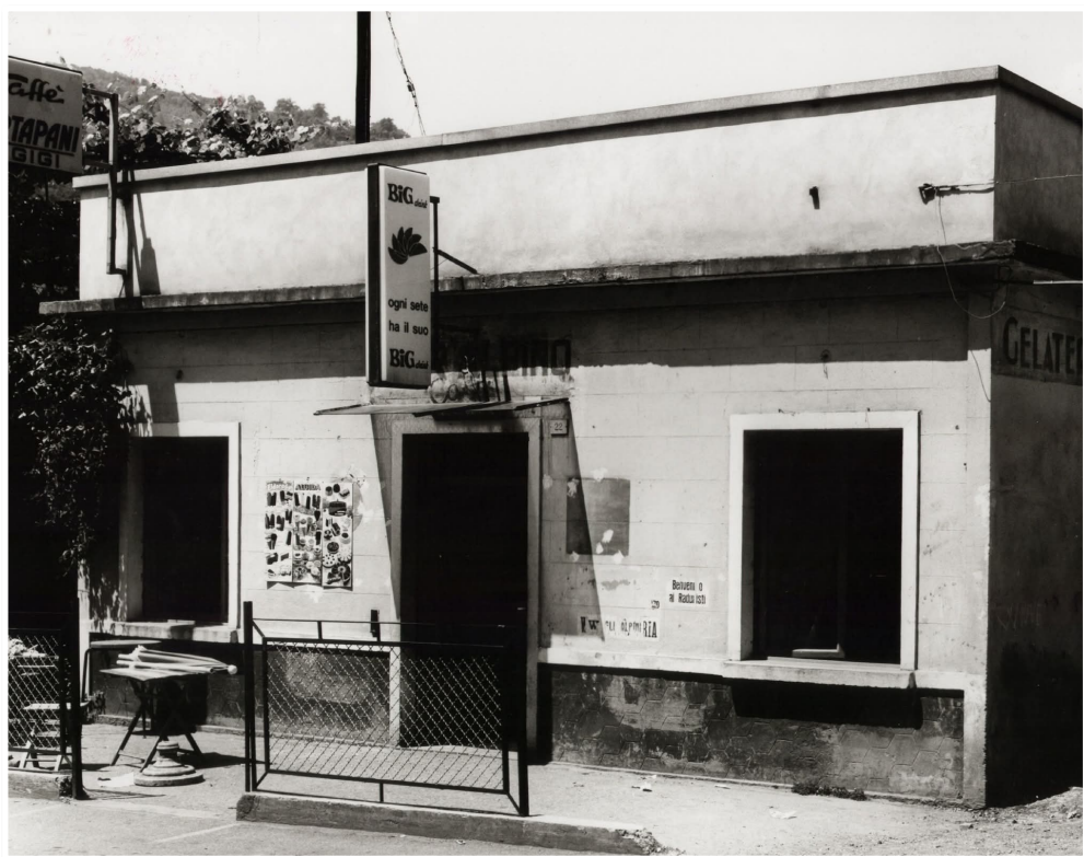
Il bar "Alpino", in via Zanardelli, sede occasionale delle riunioni degli alpini prima del 1978, quando troveranno una collocazione nel palazzo ex cooperativa di via Bailo.

Nel settembre del 1982 il Gruppo Alpini di Sarezzo porta a S. Emiliano una campana di 104 chili, dedicata ai caduti di